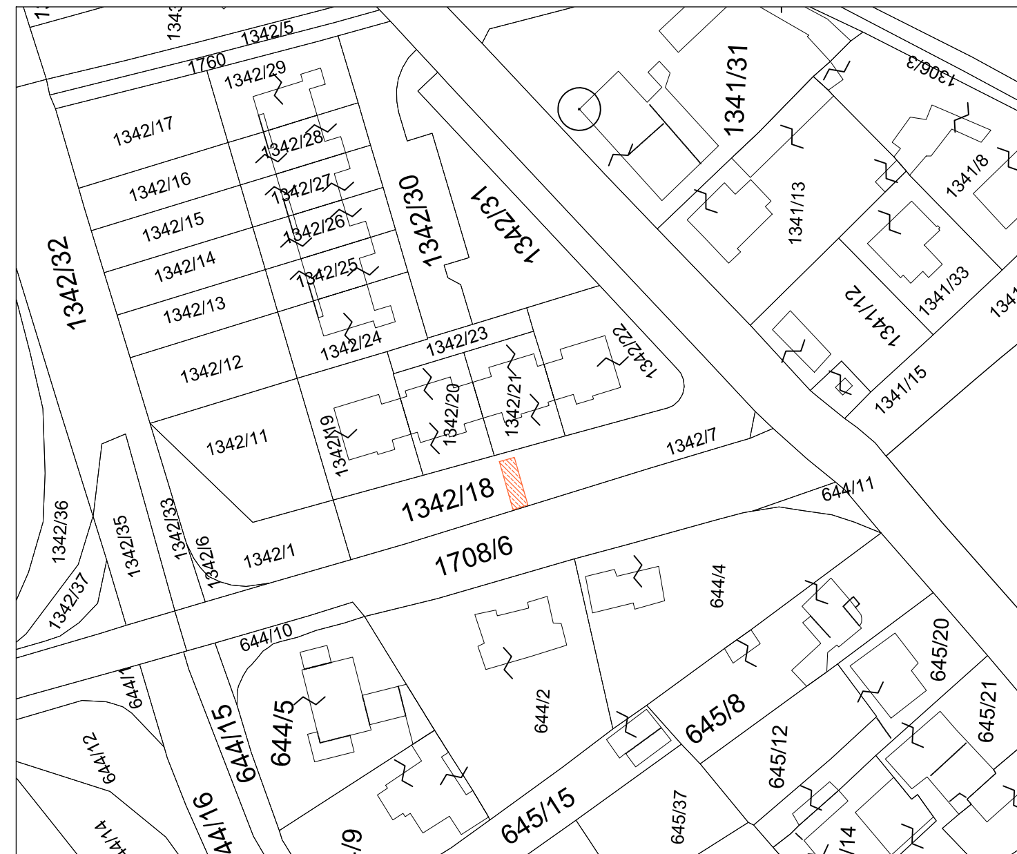
VIA CIVIDALE - FG. 6